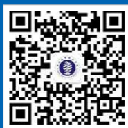
海南热带海洋学院 微信公众号