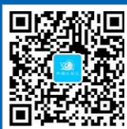
热海大资讯 微信公众号